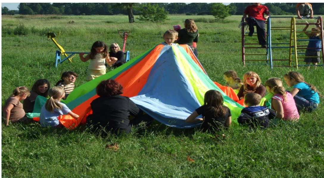
Impreza z cyklu „Dzień dziecka”