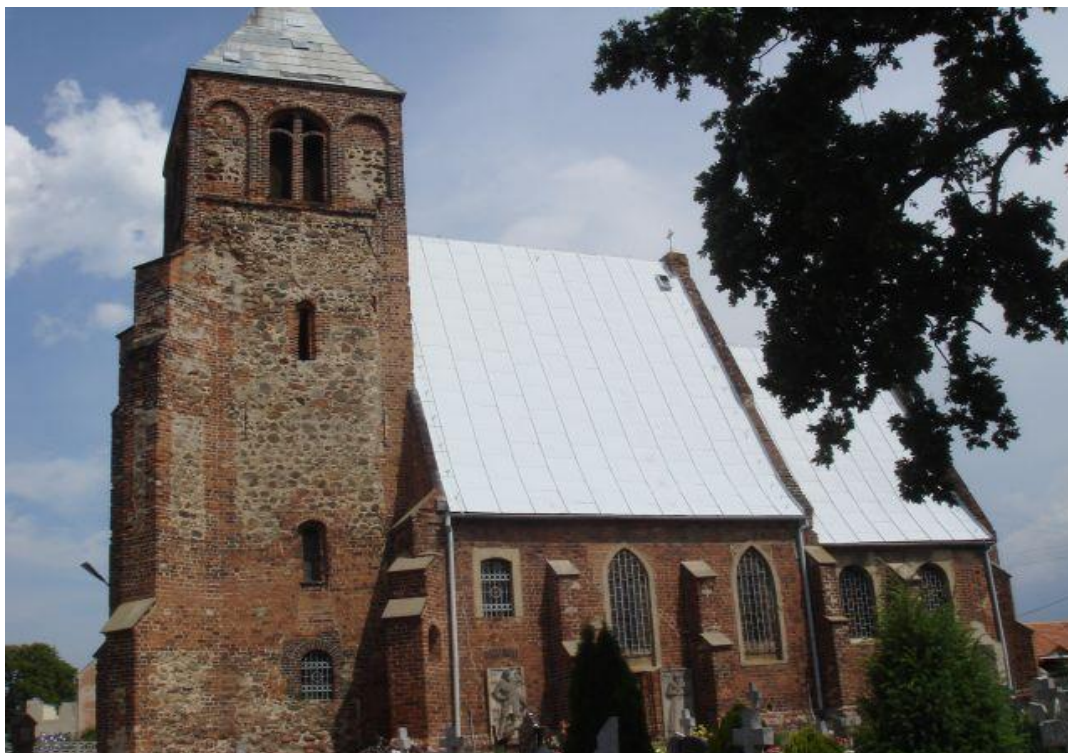
Kościół filialny w Piersnej