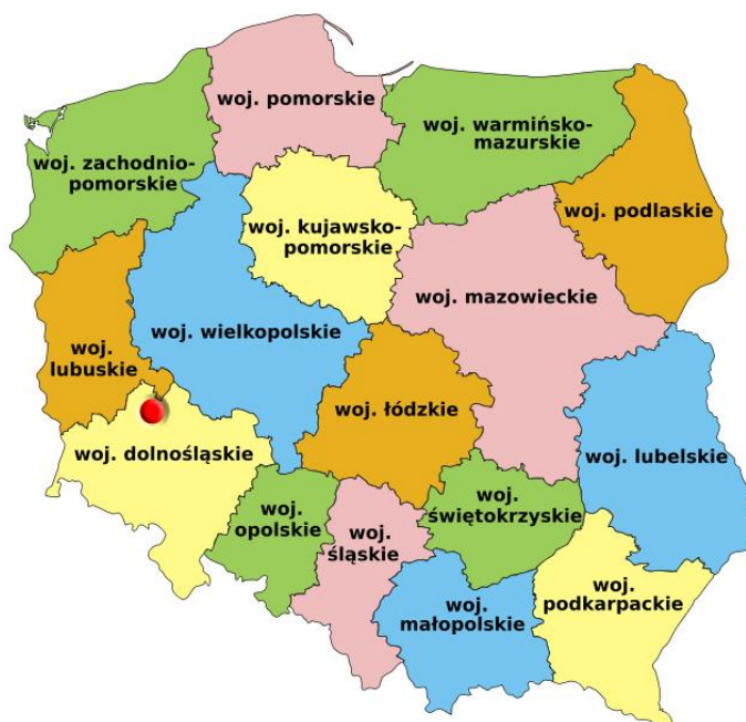
Otoczenie krajowe gminy Pęcław

Województwo dolnośląskie znajduje się przy południowo-zachodniej granicy Polski, dlatego gmina Pęcław jest położona dość blisko Czech i Niemiec (w przypadku obu tych państw odległość wynosi około 100 km).