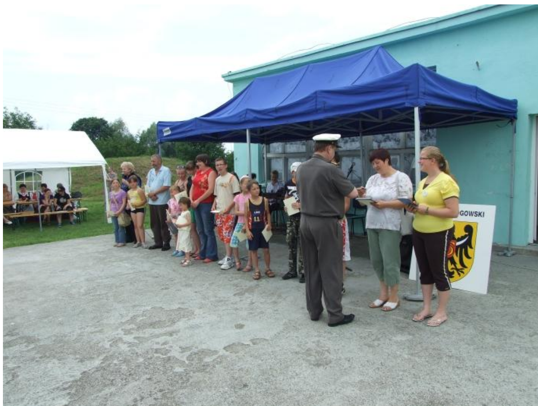
Impreza z cyklu „Flis Odrzański”