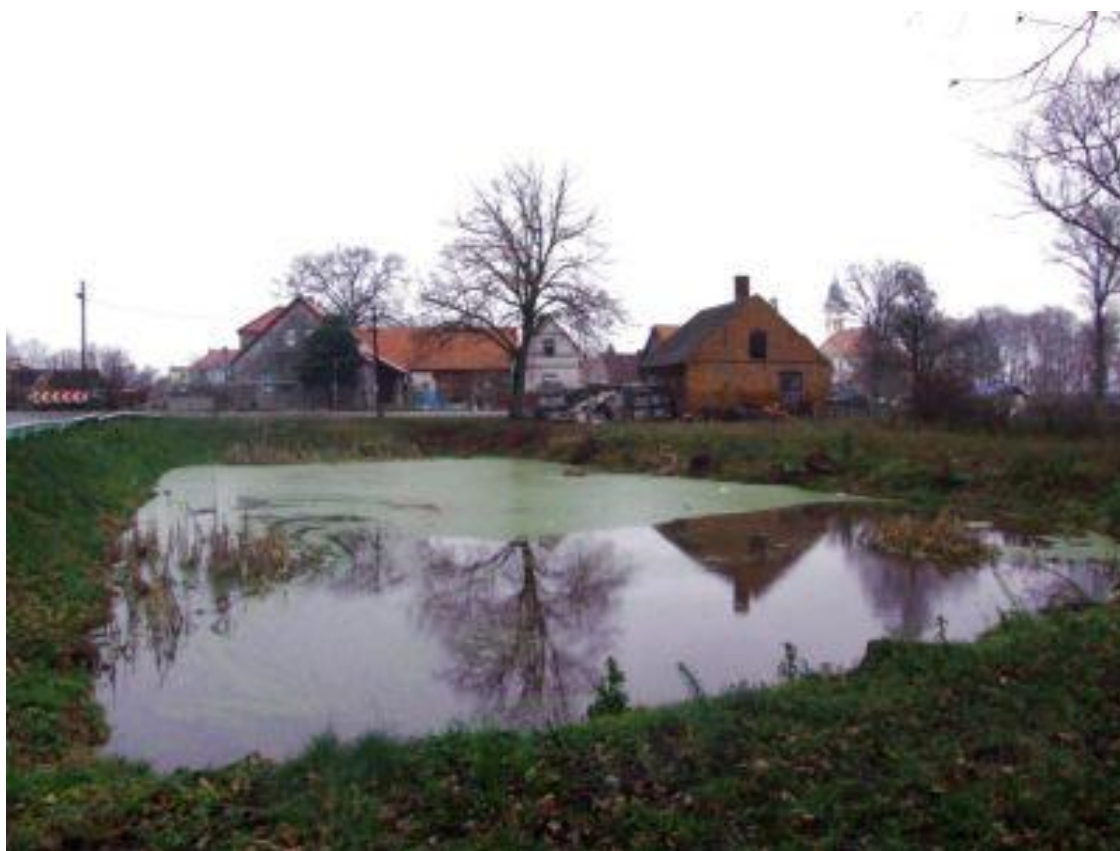
Plan Odnowy Miejscowości Wietszyce