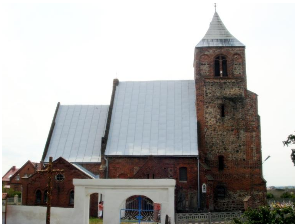
Przykładowe zabytki gminy Pęcław

Obiekty dziedzictwa historycznego Wietszyc i sąsiednich miejscowości gminy Pęcław