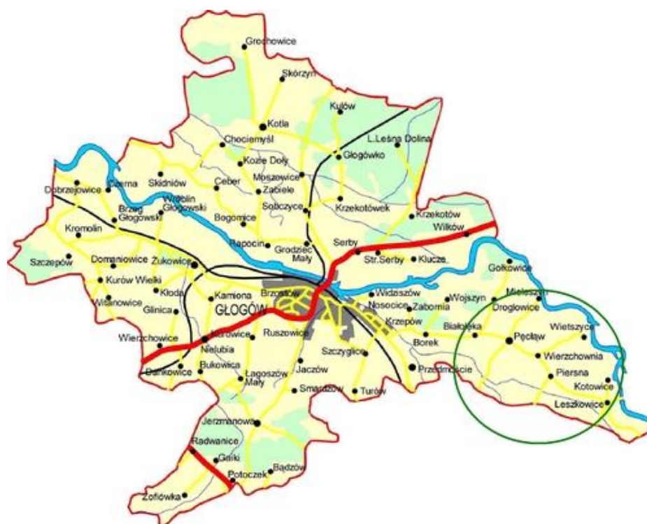
Lokalizacja gminy w otoczeniu subregionalnym, czyli powiecie głogowskim