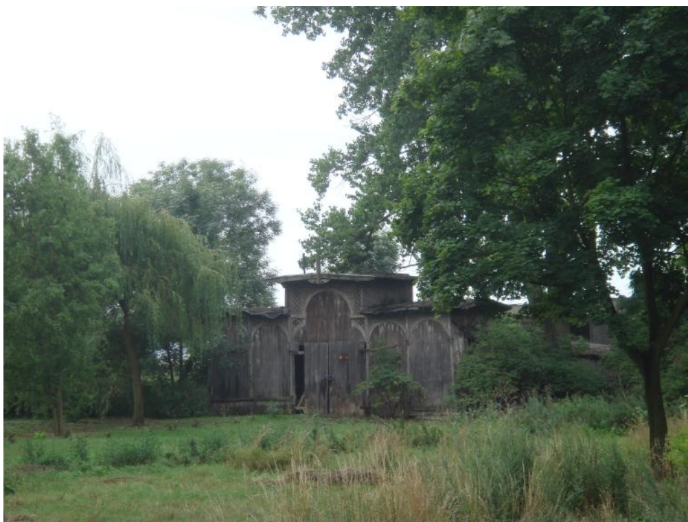
Przykładowe zabytki gminy Pęcław