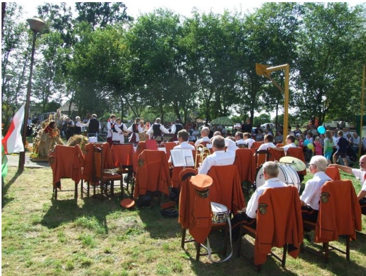
„Dożynki Gminne w Białolece”