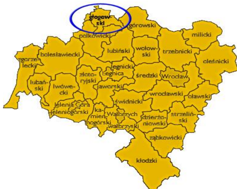
Otoczenie regionalne – powiat głogowski na tle województwa dolnośląskiego