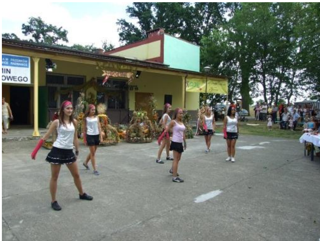
„Dożynki Gminne w Białolęce”