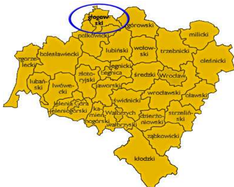
Otoczenie regionalne – powiat głogowski na tle województwa dolnośląskiego