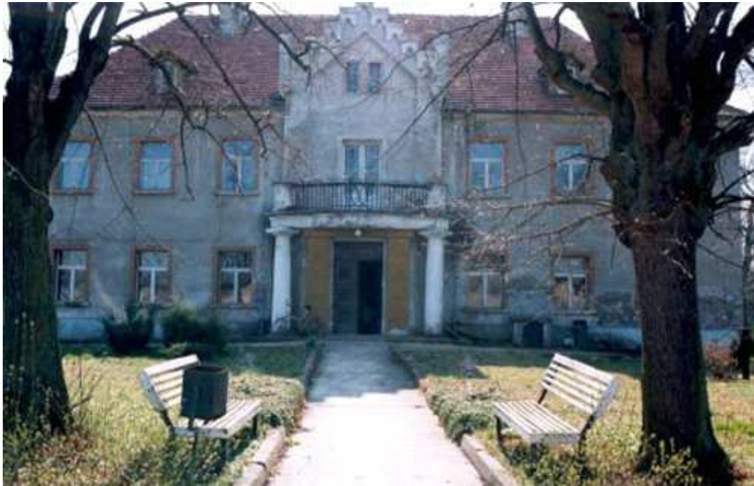
Dworek w Leszkowicach

Zabytkowe obiekty oraz przedstawione w poprzednim rozdziale wartości przyrodnicze to podstawowe walory, które stanowią o atrakcyjności turystycznej gminy Pęcław.