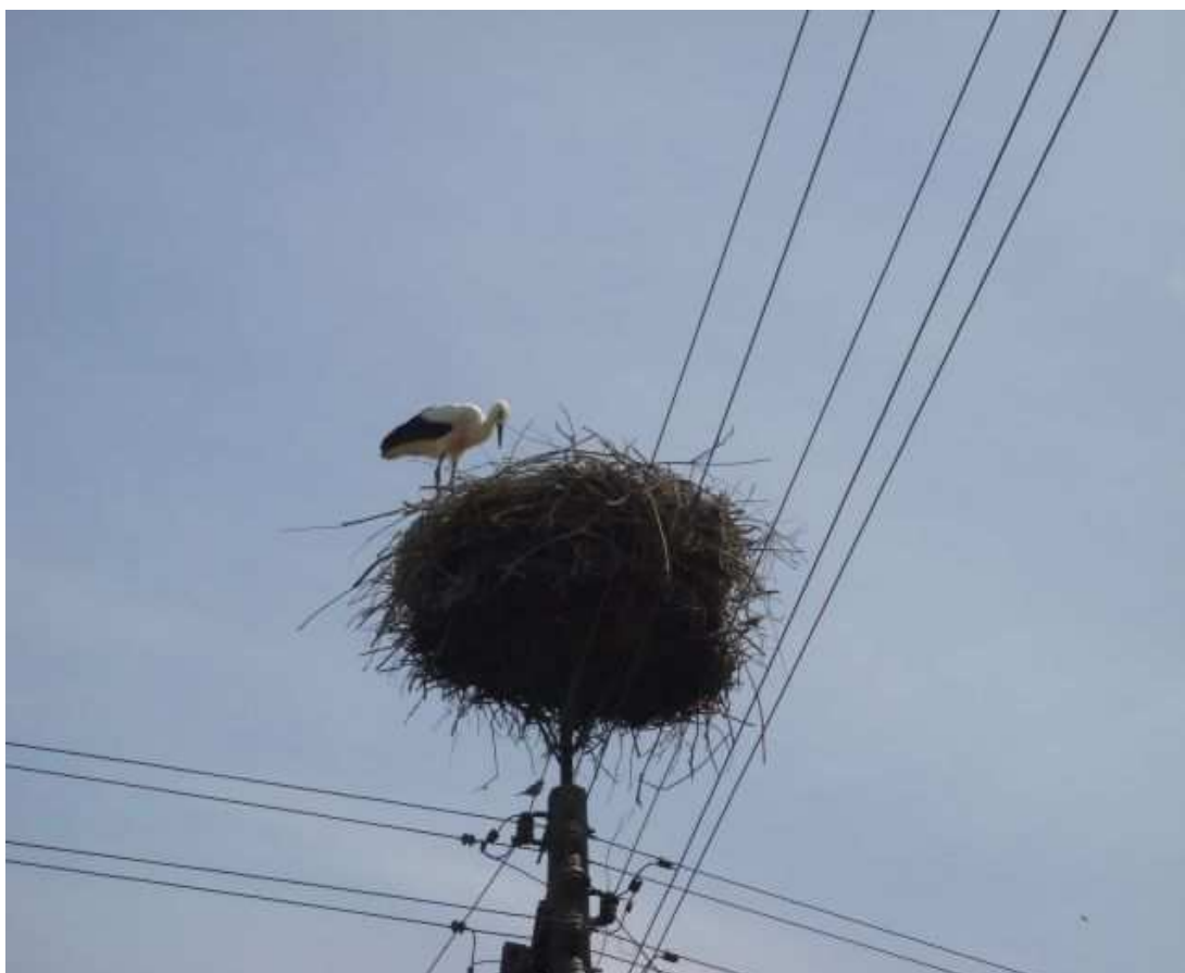
Walory przyrodnicze gminy Pęcław

najłagodniejszych w Polsce należy klimat. Przeciętnie w skali roku 28 dni oznacza się ujemną temperaturą, natomiast dni gorących (z temperaturą powyżej 25 °C) jest 34. Często występują przymrozki, mgły, rosa i szron. Średnioroczny poziom opadów wynosi około 500 mm. Okres wegetacyjny obejmuje 100 dni. Lasy zajmują 9 % powierzchni gminy. Są to głównie przyodrzańskie bory bagienne, lasy wilgotne i łąkowe – te ostatnie stanowią ciekawe skupiska roślin i zwierząt. Dla doliny Odry charakterystyczne są liczne siedliska ptactwa wodnego oraz właściwy dla tego ekosystemu świat owadów i płazów. Jest to również ważny szlak przelotów ptaków. W 1986 r. na przyodrzańskich terenach został utworzony obszar krajobrazu ochronnego, w którym znajduje się dużo starorzeczy, oczek wodnych, zabagnień i cały system rowów melioracyjnych.