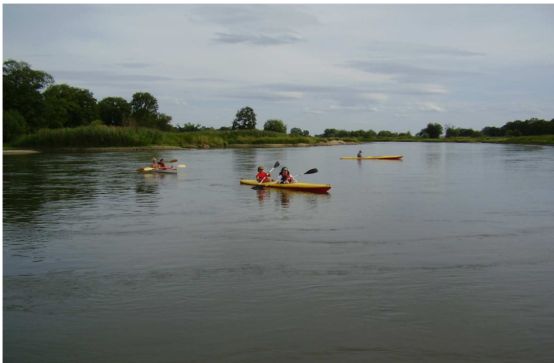
Spływ kajakowy