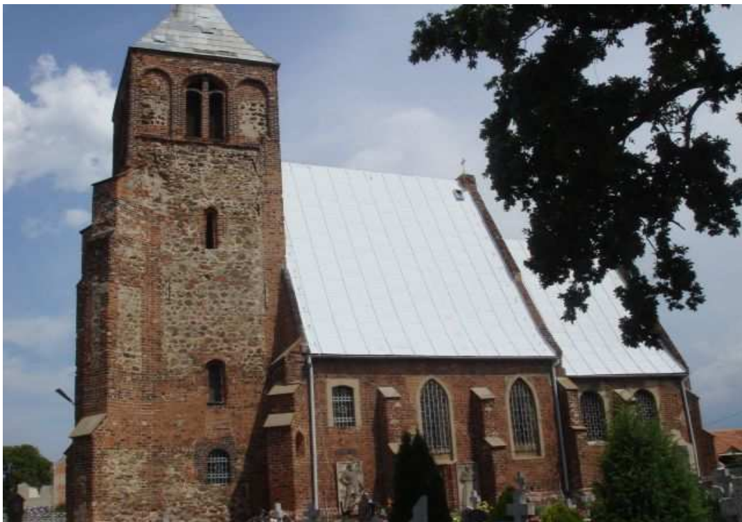
Kościół filialny w Piersnej