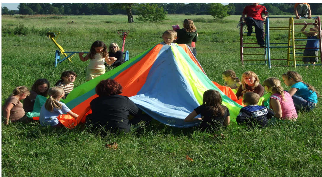
Impreza z cyklu „Dzień dziecka”