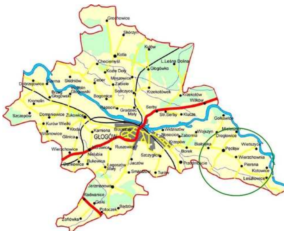
Lokalizacja gminy w otoczeniu subregionalnym, czyli powiecie głogowskim