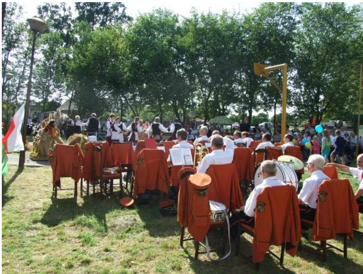
„Dożynki Gminne w Białoleka”