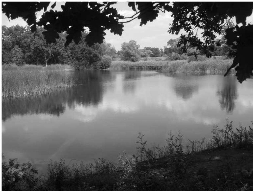
Walory przyrodnicze gminy Pęcław

Dla doliny Odry charakterystyczne są liczne siedliska ptactwa wodnego oraz właściwy dla tego ekosystemu świat owadów i płazów. Jest to również ważny szlak przelotów ptaków. W 1986 r. na przyodrzańskich terenach został utworzony obszar krajobrazu ochronnego, w którym znajduje się dużo starorzeczy, oczek wodnych, zabagnień i cały system rowów melioracyjnych.