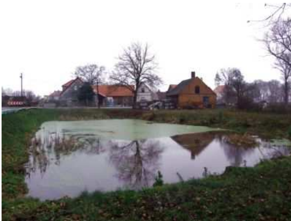
Plan Odnowy Miejscowości Wietszyce