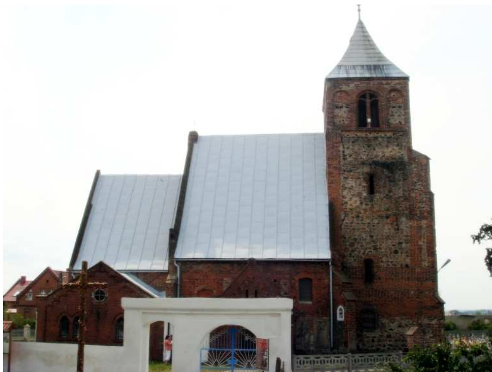
Przykładowe zabytki gminy Pęcław

Obiekty dziedzictwa historycznego Wietszyc i sąsiednich miejscowości gminy Pęcław