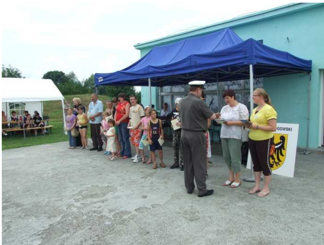
Impreza z cyklu „Flis Odrzański”