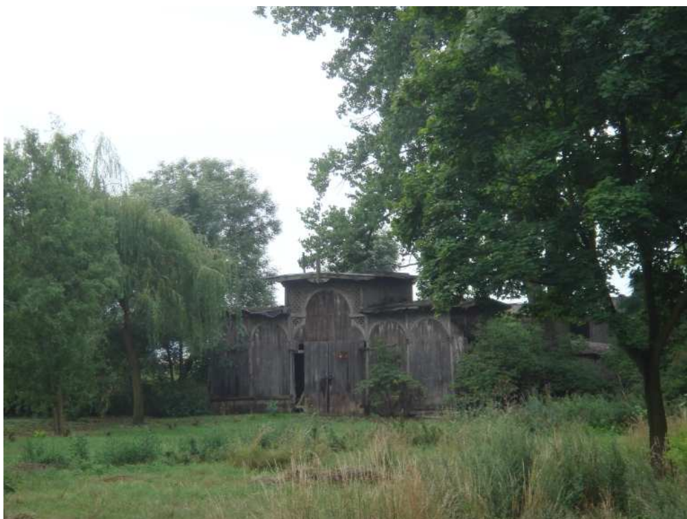
Przykładowe zabytki gminy Pęcław