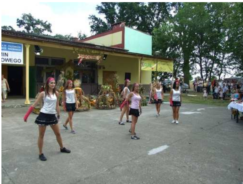
„Dożynki Gminne w Białoleńcu”