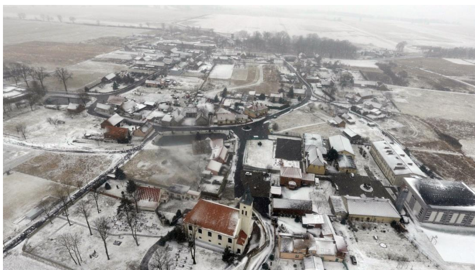
Fot. Fotografia lotnicza Białołęki z widoczną owalnicą. Na

mieszkalną służby oraz parobków wzdłuż wschodniego podjazdu do kompleksu.