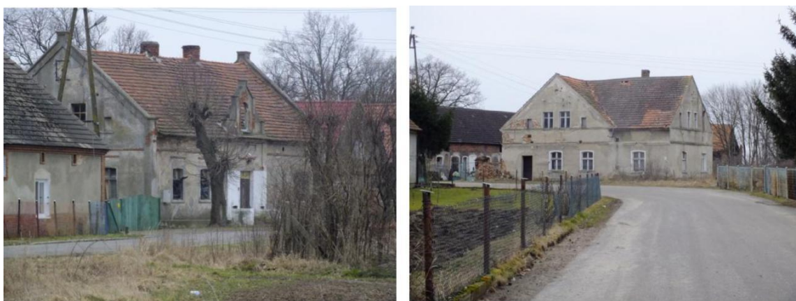
Fot. Historyczne gospody i zajazdy: po lewej w Kotowicach, po prawej – w Leszkowicach

opuszczonym). Odznaczały się bardziej skomplikowaną bryłą i bogatszą dekoracją architektoniczną, którą po II wojnie światowej częściowo utraciły, ulegając kolejnym przekształceniom.