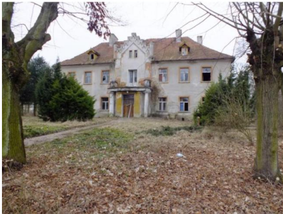
Fot. Dwór w Leszkowicach (po lewej) i klasycyzujący pałac w Droglowicach (po prawej)