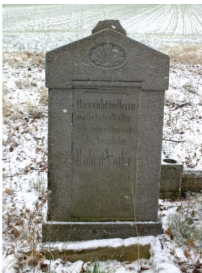
Fot. Epitafium w Piersnej oraz zachowany nagrobek na cmentarzu w Wojszynie.