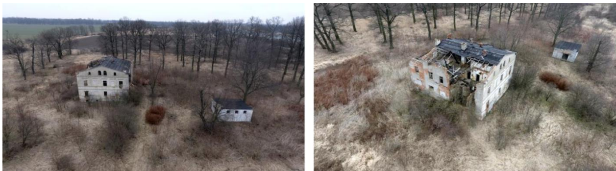
Fot. Zespół pałacowy w Kotowicach.

W Kotowicach, będących jednym z najstarszych majątków szlacheckich gminy Pęcław, zlokalizowany jest silnie zdewastowany zespół parkowo – pałacowy. Pałac na rzucie prostokąta kryty dachem dwuspadowym powstał najpewniej w latach 70. XIX wieku, prawdopodobnie na miejscu starszej rezydencji. Zespół z roku na rok popada w ruinę.