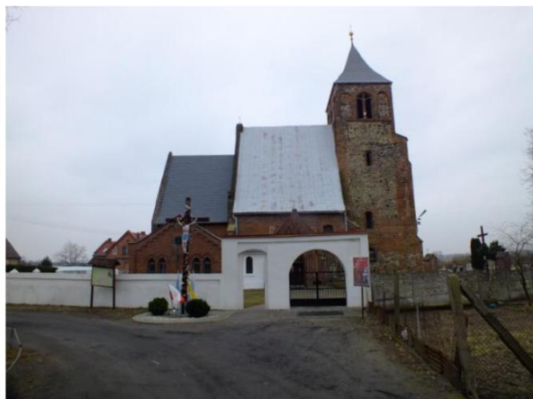
Fot. Kościół w Białołęce (po lewej) oraz w Piersnej (po prawej)