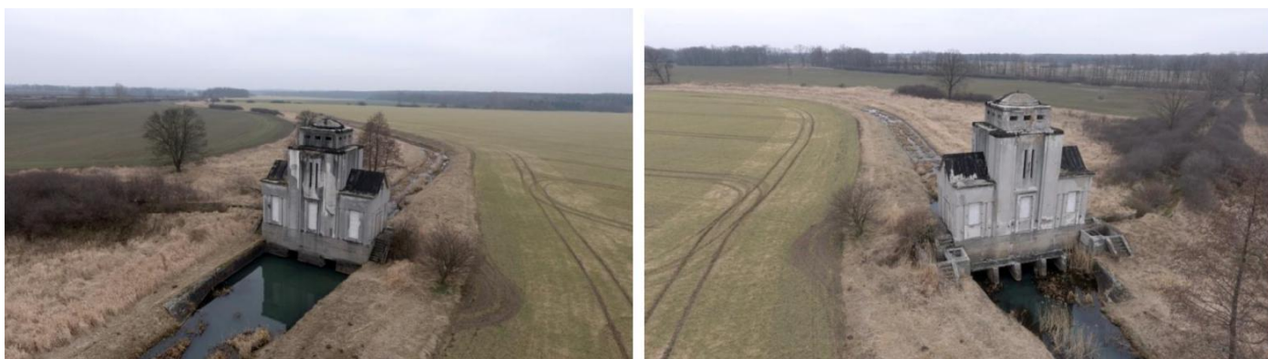
Fot. Jeden z najcenniejszych obiektów zabytkowych w gminie – przepompownia w Leszkowicach.

Reliktem dawnej przystani w Borkowie jest położona na wałach nad Odrą restauracja, ob. dwukondygnacyjny dom mieszkalny, która uległa w ostatnich dziesięcioleciach wielokrotnym przekształceniom zacierającym pierwotny charakter architektoniczny. W Golkowicach i Leszkowicach zachowały się natomiast kamienne drogi prowadzące do przeprawy.