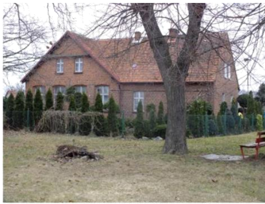
Fot. 7. i 8. Dawna szkoła w Wietszycach (po lewej) i w Kotowicach (po prawej).

Na terenie gminy Pęcław nigdy nie rozwinęły się miasta, stąd mówić można jedynie o układach ruralistycznych. Przez wieki najważniejszą osadą w regionie była Białołęka, której średniowieczna struktura owalnicy pozostaje do dziś czytelna. Układ ten miał charakter obronny, z zabudową mieszkalno – gospodarczą na okręgu koła ze wspólnym pastwiskiem w środku. Zabudowę wsi takich jak Drogłowice, Wierzchownia, Wojszyn czy Mileszyn rozplanowano natomiast wzdłuż traktów komunikacyjnych, linearnie, stanowią one przykład tzw. niwowych „ulicówek”, których koncepcja została nieznacznie zaburzona wraz z powstaniem nowej zabudowy po 1945 roku. Bardziej nieregularnym rozplanowaniem