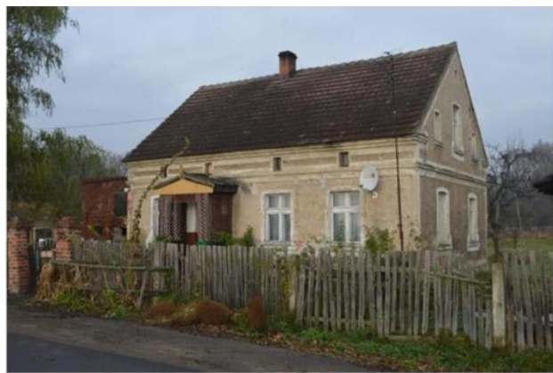
Fot. 1 i 2. Charakterystyczne budynki mieszkalne: dom nr 4 w Wojszynie (po lewej) oraz dom nr 35 w Borkowie (po prawej).

Zachowało się kilkanaście domów mieszkalnych wzbogaconych bardziej urozmaiconym detalem architektonicznym. Wśród nich warto wymienić m.in. ob. Urząd Gminy, z uskokową opaską ścian szczytowych, lizenami w narożach i wazami wieńczącymi szczyty (Pęcław 28), dom nr 3 i 42 w Białotęce z ozdobnymi otworami okiennymi ryzalitu osiowego i szczytów elewacji bocznych czy gospodę w Kotowicach oraz dom nr 41 w Białotęce ze ścianką szczytową na osi fasady, odwołującą się swą formą do wzorców neogotyckich.