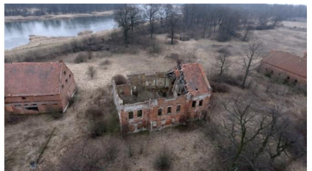
Fot. Założenie dworskie w Mileszynie wraz z towarzyszącymi budynkami gospodarczymi.