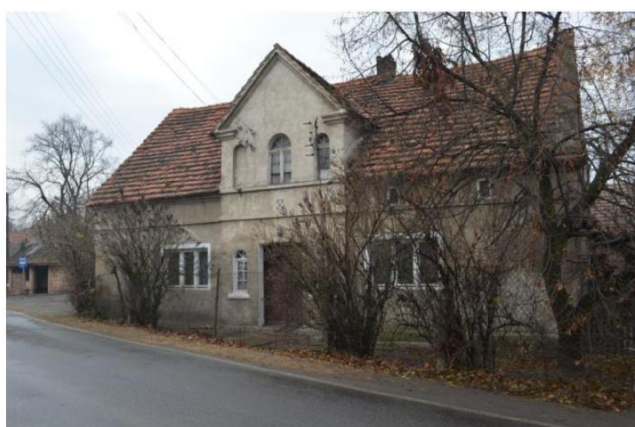
Fot. 3. i 4. Budynki mieszkalne z zachowanym oryginalnym detalem architektonicznym: dom nr 3 oraz dom nr 42 w Białotęce.