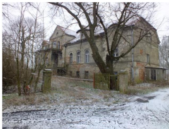
Fot. Pałac w Białoleścu (po lewej) i w Turowie (po prawej).