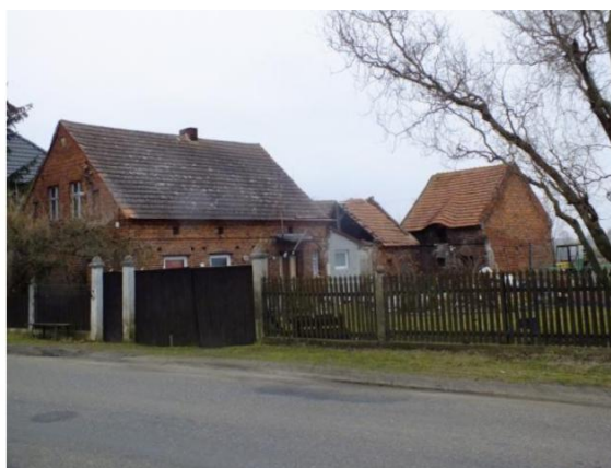
Fot. 5. i 6. Charakterystyczna zabudowa gospodarcza z obszaru gminy: stodoła przy domu nr 15 w Wojszynie (po lewej) oraz budynek gospodarczy w Wierzchowni (nr 11; po prawej).

Z opisanego wzorca kompozycyjnego wyłamuje się dwukondygnacyjny spichlerz przy bud. mieszkalnym nr 27 w Droglowicach oraz zachowany częściowo budynek gospodarczy przy domu nr 11 w Wierzchowni (za sprawą falistej formy dachu). Wszystkie opisane obiekty pochodzą z przełomu XIX i XX w., pojedyncze z lat 70/90. XIX w. Ponadto w Droglowicach ok. 1870 r. wzniesiono na planie wydłużonego prostokąta owczarnię, która dziś w połowie użytkowana jest jako dom mieszkalny.