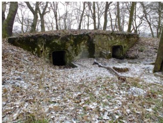
Fot. Bunkier w Borkowie (po prawej) i w Golkowicach (po lewej).